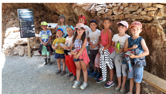
Visite des grottes de la Carbonières