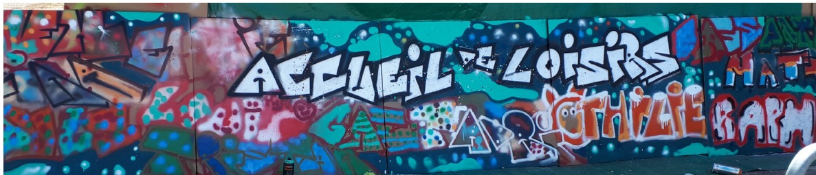
Quelques nouvelles du centre de loisirs de Pinsac depuis juillet 2018

Découverte de la technique du Graf avec Kevin lors des vacances de Juillet 2018