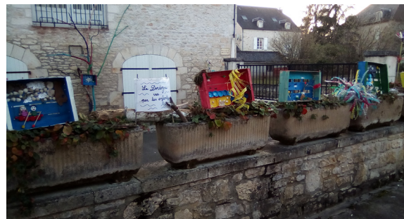
Exposition la "Dordogne" vue par les enfants du centre de loisirs.