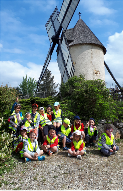
Visite du village du Bournat avec 17 enfants