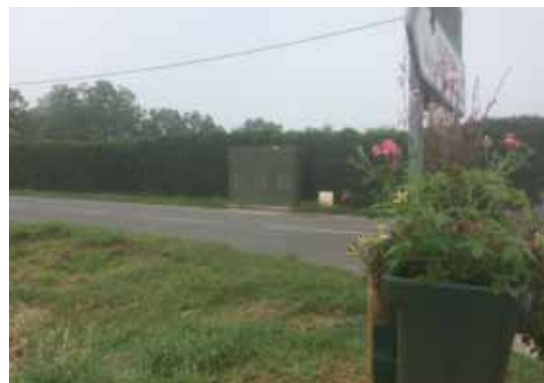
La nouvelle armoire sur la D 43 en bas du lotissement du Pech de La Brame.

Cependant il subsiste encore quelques problèmes. Plusieurs d'entre nous peuvent témoigner que pour eux la montée en puissance n'est pas encore effective alors même qu'ils sont tout près de la nouvelle armoire. Le problème peut venir de la box qui est ancienne.