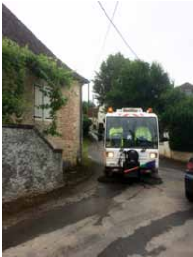
La balayeuse dans Terregaie