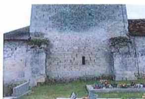
Vue extérieure sur la nef de l'église.