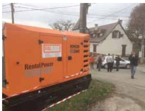
Le groupe électrogène posé par un prestataire d'ENEDIS est resté en action environ 3 mois et demi

Lors de la 1ère inondation du 05 janvier, la ligne 20 000 volts venant de Lacave à été coupée et 3 poteaux emportés par la Dordogne. ENEDIS a fait installer un groupe électrogène pour alimenter en électricité les habitants de Blanzaguet. Malgré quelques difficultés au début, celui-ci a permis aux habitants de pouvoir avoir de l'électricité. Cela n'a pas été sans coupures intempestives mais le groupe a pu pallier à la rupture de la ligne.