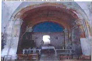
Vue intérieure de l'église.