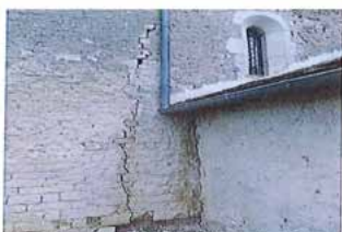
Détail de la façade sur le mur de la nef. Les pierres sont très vieilles et les joints sont très érodés. La maçonnerie est très ancienne et nécessite des travaux de restauration.