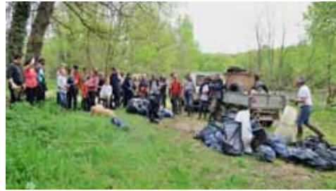
Bravo aux enfants de Blanzaguet pour leur participation active