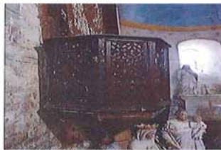
Détail de la chaire de l'église.

Cette fois, c'est parti pour les travaux de réfection de la toiture. Le calendrier des travaux est fixé pour un début au 15 septembre et l'achèvement au 15 janvier 2019 date maximum. C'est officiel : un dossier à la Fondation du Patrimoine est ouvert. Vous pouvez comme d'autres l'ont déjà fait remplir un bulletin de souscription auprès de l'association des Amis de Blanzaguet ou auprès de la Mairie. Pour rappel la déduction directe sur vos impôts est de 66,66%. Pour exemple sur