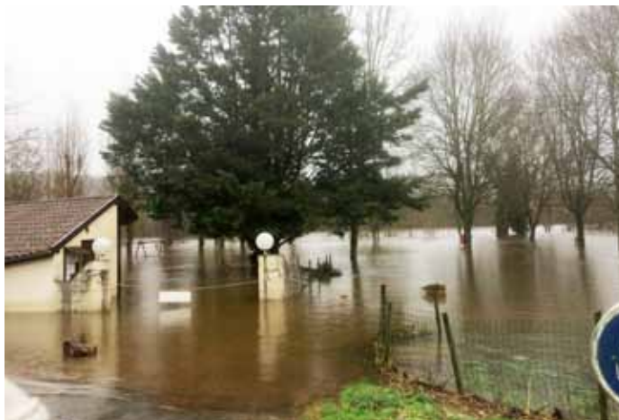
Photo lors de la 1ère crue de la Dordogne le 05 janvier 2018 au camping du port de Pinsac

La Dordogne est sortie trois fois de son lit cet hiver. Heureusement les dégâts sont restés peu nombreux, même si des personnes habitant en bord de Dordogne ont été touchées. Comme vous pouvez le lire ci-dessous les crues ont été bien plus fortes par le passé.