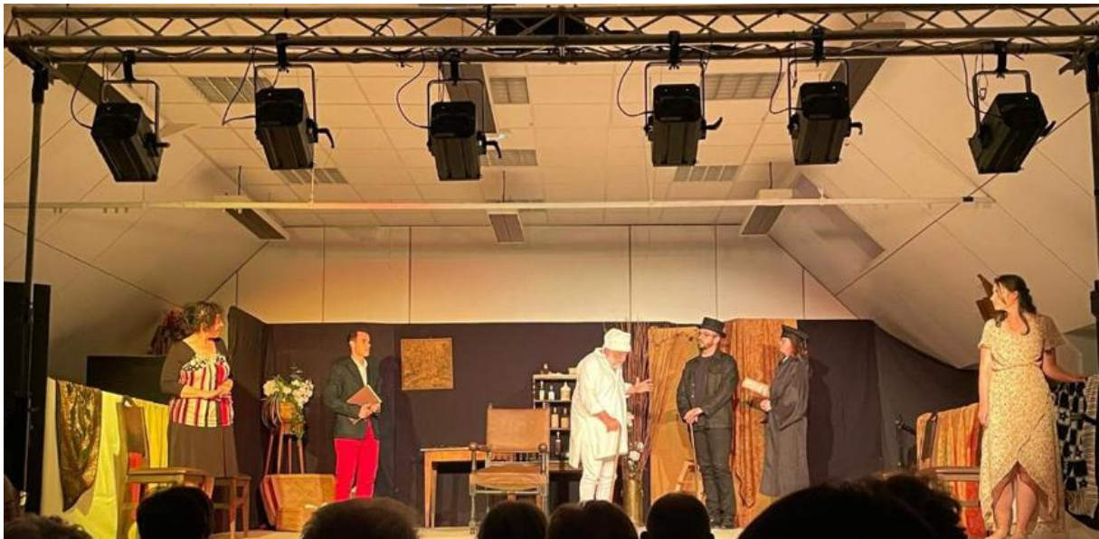
La représentation du 28 mai 2022 à Pinsac